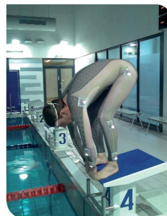
Costume a led per misurazione della partenza