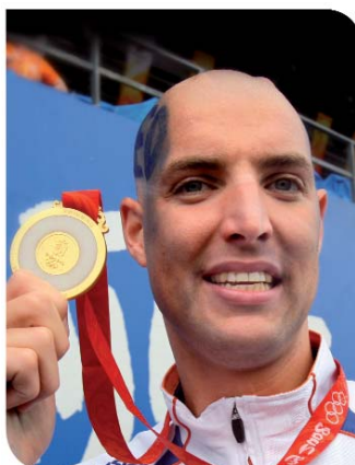
Il campione olimpionico Maarten van der Weijden

Una testimonianza speciale: "In che modo le innovazioni applicate allo sport hanno influenzato le mie prestazioni sportive"