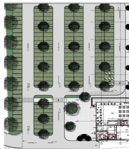
Visione Piano terra

Nell'ambito di una politica di crescita qualitativa nel settore della formazione motoria e sportiva, l'Università degli Studi di Urbino Carlo Bo ha intrapreso un restyling delle strutture dedicate alla Scuola di Scienze Motorie. Nei primi giorni di Ottobre sono state consegnate all'Ateneo le 3 nuove aule da 350 posti l'una dedicate alla didattica frontale e nei prossimi giorni partiranno i lavori per la realizzazione di un vero e proprio campus sportivo.